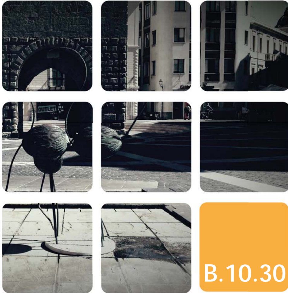
Sviluppo dell'isolato 30