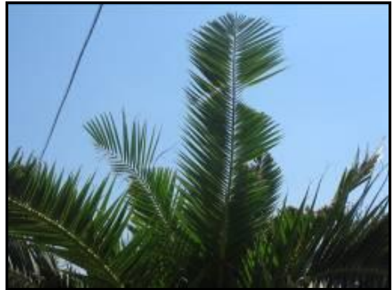
Fig. 3 Margini seghettati e rosure fogliari

Successivamente si ha un gradiente di danno sempre più intenso con la cima che si piega e la chioma che si appiattisce. La pianta, da un'osservazione a distanza, appare come appiattita.