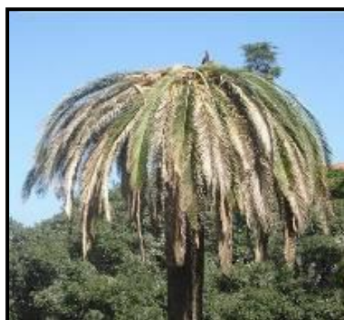
Fig. 5 Disseccamento generalizzato e appiattimento

L'esito finale dell'infestazione di Rhynchophorus ferrugineus sui vegetali di palma è la morte della pianta, la cui chioma presenta tutte le foglie secche e ripiegate verso il basso, in una tipica forma ad ombrello.