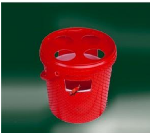
Fig. 1. Trappola a feromoni