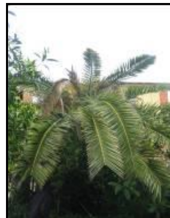
Fig. 4 Asimmetria della chioma e appiattimento

L'esito finale dell'infestazione di Rhynchophorus ferrugineus sui vegetali di palma è la morte della pianta, la cui chioma presenta tutte le foglie secche e ripiegate verso il basso, in una tipica forma ad ombrello.