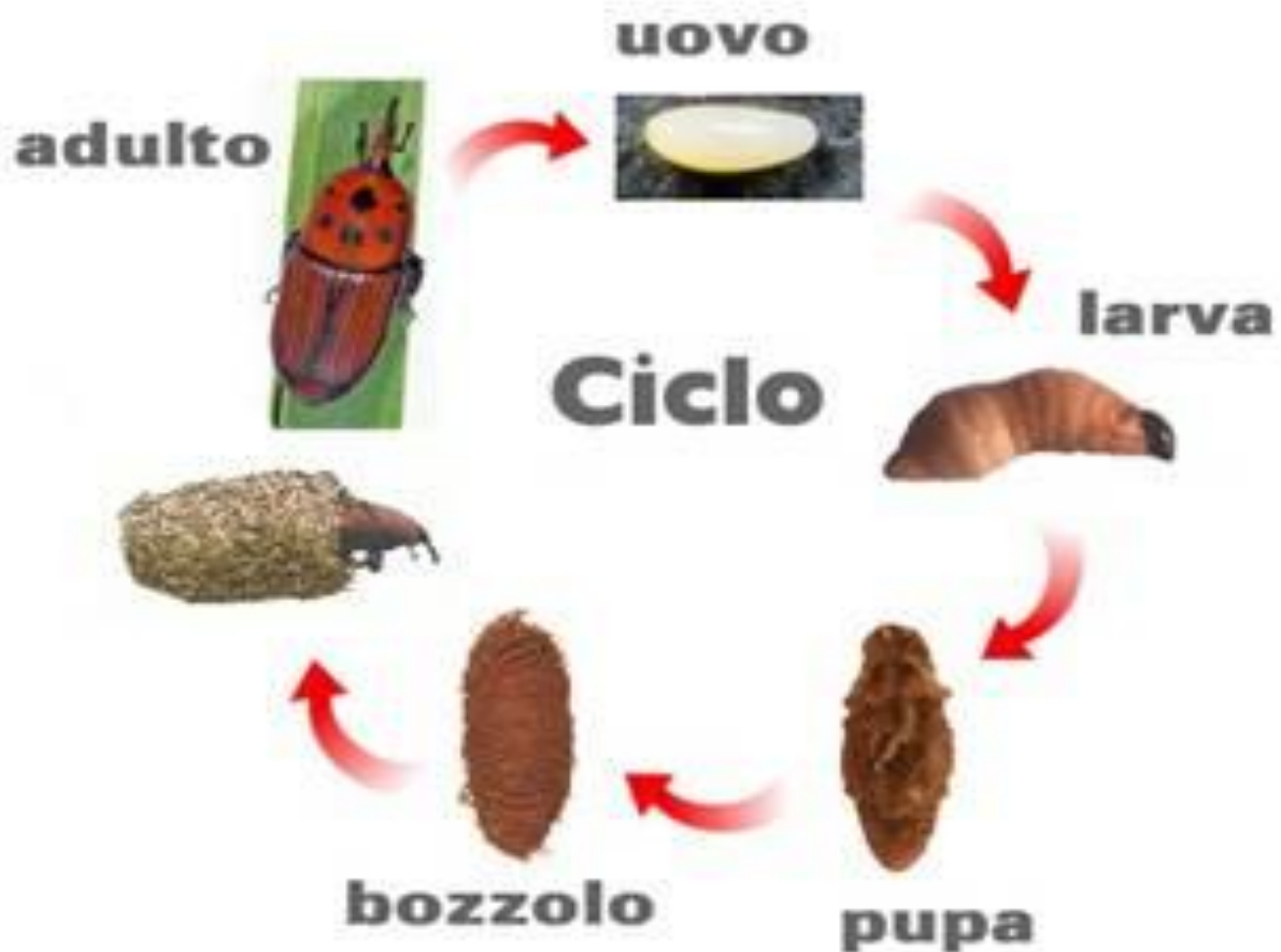
Fig. 2 Ciclo biologico del punteruolo

Negli areali di origine, caratterizzati da un clima caldo tropicale, il punteruolo rosso compie più generazioni nel corso dell'anno ognuna delle quali si completa in circa 3 mesi e mezzo. La femmina vive circa 3 mesi e depone in media 200 uova nelle ferite delle palme, dopo 2-3 gg dall'ovideposizione nascono le larve, che completano lo sviluppo in 2-3 mesi; mentre la durata del successivo stadio pupale varia da 15 a 50 giorni.