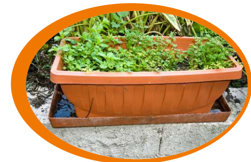
Elimina i sottovasi e, se non puoi toglierli, evita il ristagno d'acqua