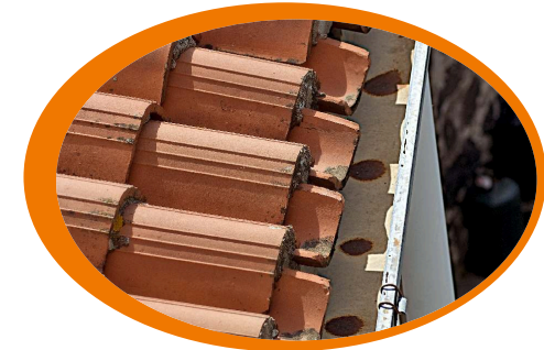
Controlla periodicamente le grondaie mantenendole libere e pulite