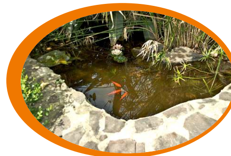
Tieni pulite fontane e vasche ornamentali, eventualmente introducendo pesci rossi (predatori di larve di zanzare)