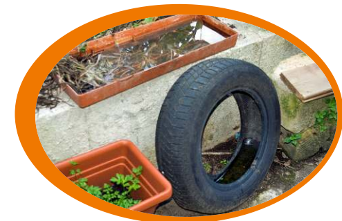
Evita di abbandonare i pneumatici e di far ristagnare l'acqua