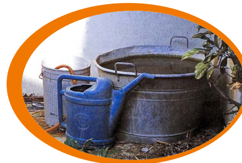
Non lasciare gli annaffiatori e i secchi con l'apertura rivolta verso l'alto