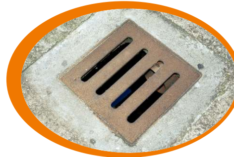
Pulisci accuratamente i tombini e le zone di scolo

Proteggiamoci dalle punture: usiamo zanzariere alle finestre, repellenti e abbigliamento adeguato quando siamo all'aperto soprattutto all'alba e al tramonto.