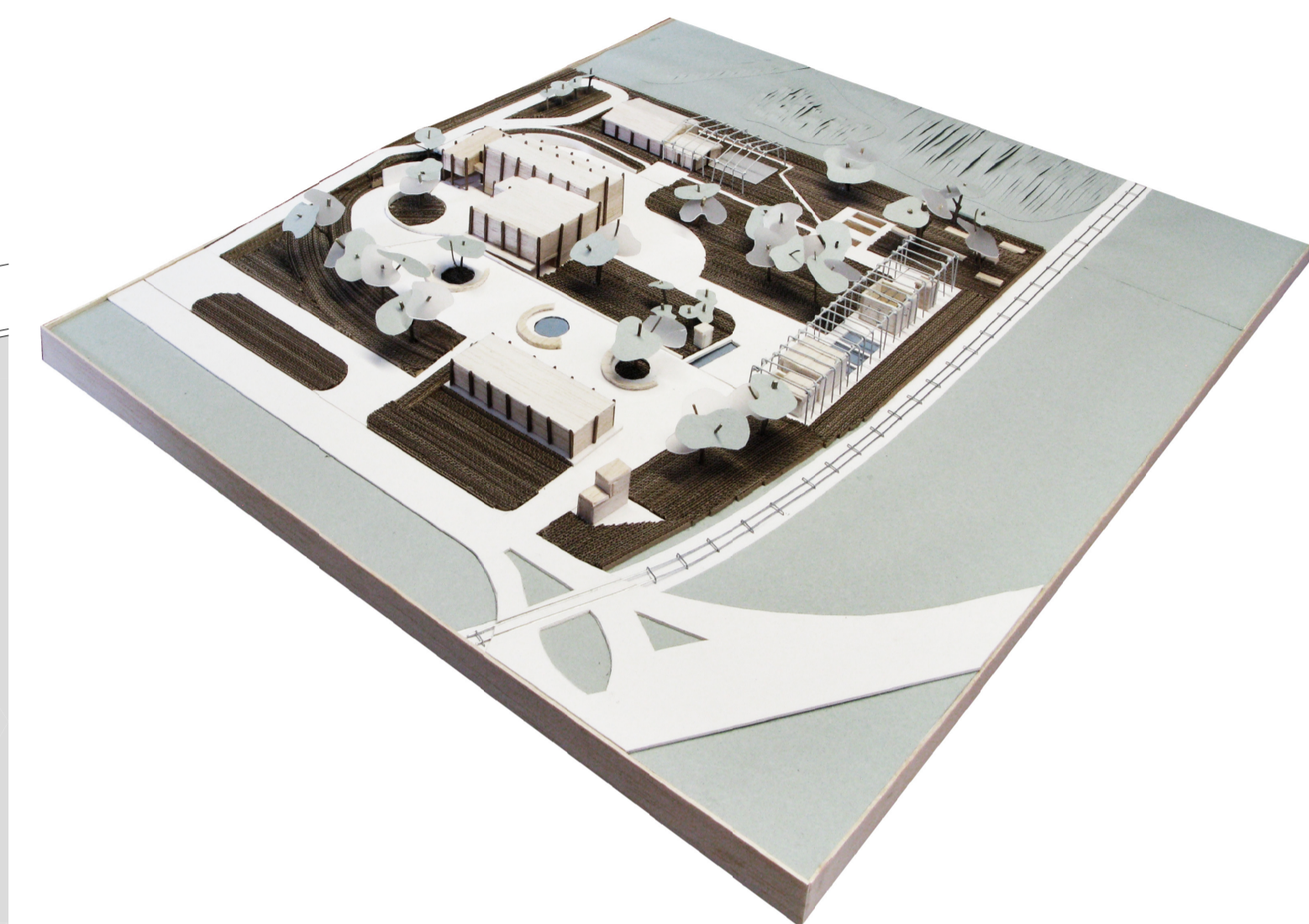
FOTO PLASTICO DI PROGETTO