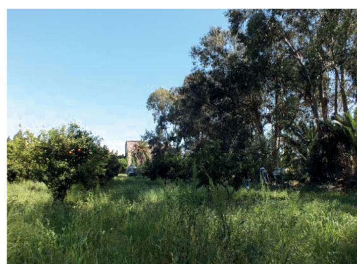
12. Agrumeto, sullo sfondo la Villa.