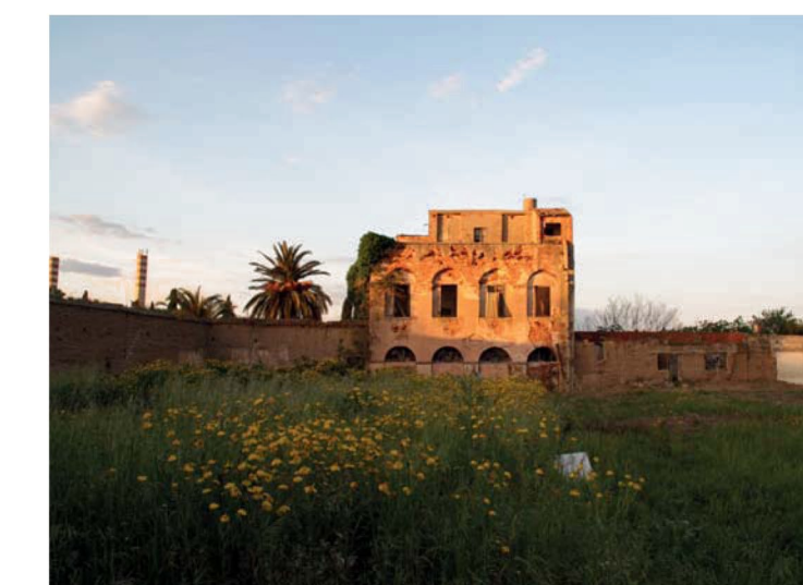
18. Villa Eleonora, prospetto sud