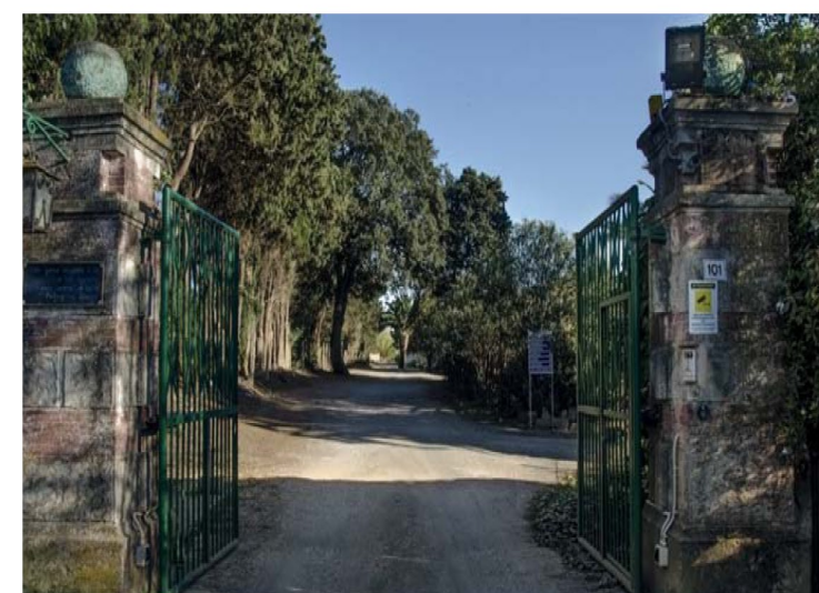
3. Cancello d'ingresso