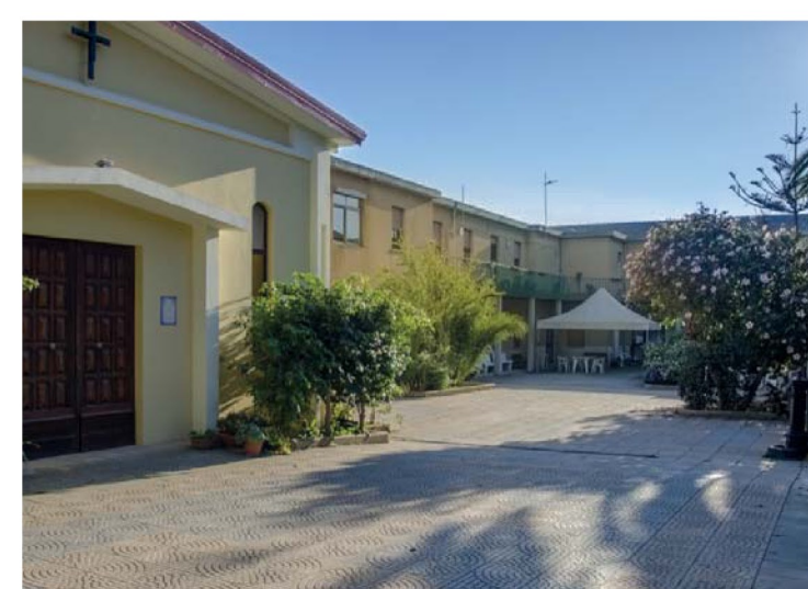
7. Giardino della Casa di Riposo