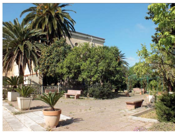
8. Giardino della Casa di Riposo