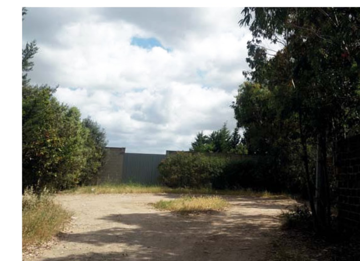
20. Cancello dell'area su Vico Volta II