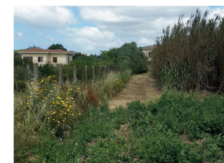
21. Sentiero lungo la recinzione sud