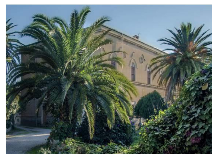
11. Edificio e giardino storici della Casa di Riposo