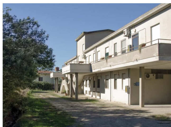
11. Prospetto ovest Casa di Riposo