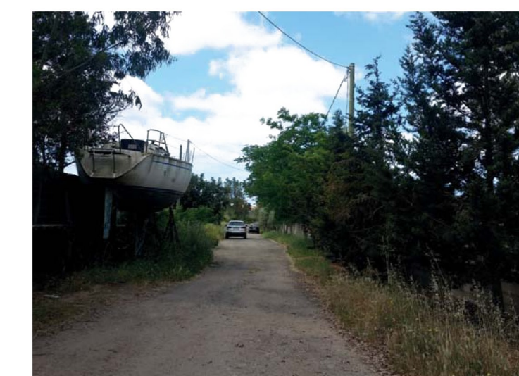
19. Vico Volta II, vista verso sud