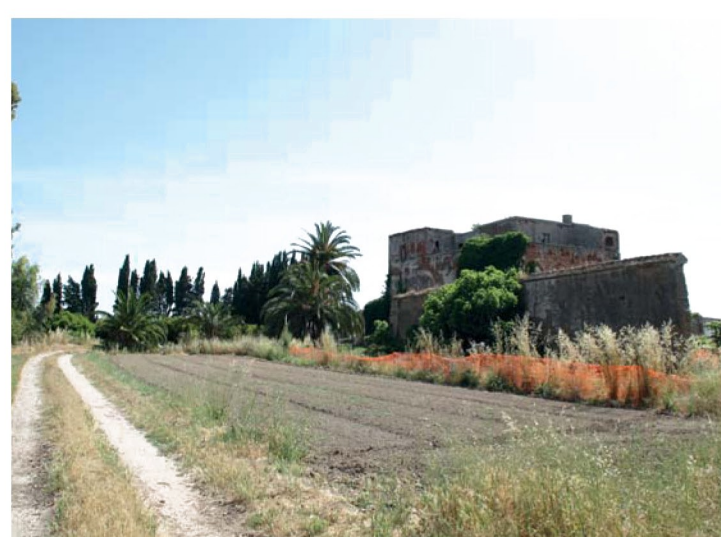
14. Vista d'insieme della Villa