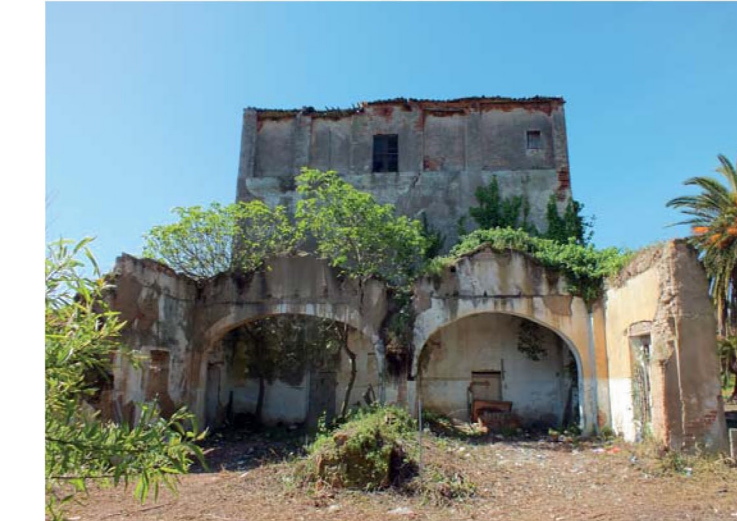
16. Villa Eleonora, prospetto nord