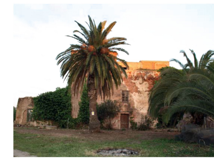
15. Villa Eleonora, prospetto ovest