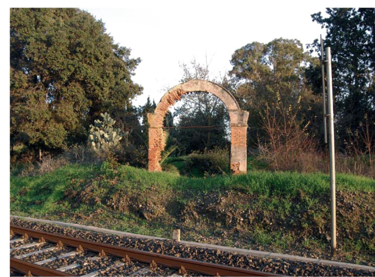
1. Ingresso originario alla Villa