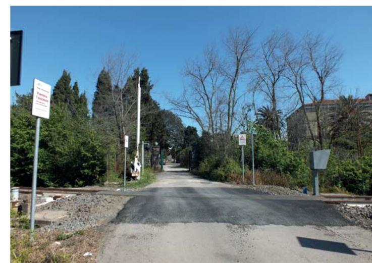
2. Passaggio a livello da via V. Casu