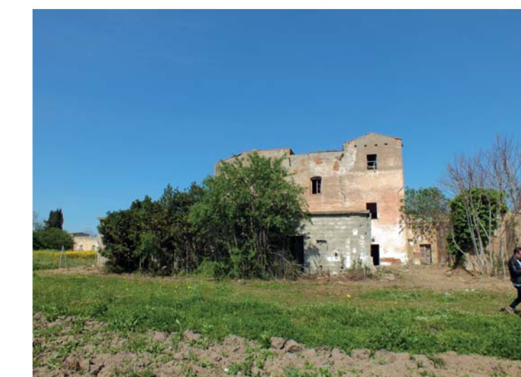
17. Villa Eleonora, prospetto est