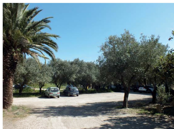
10. Cortile degli ulivi della Casa di Riposo