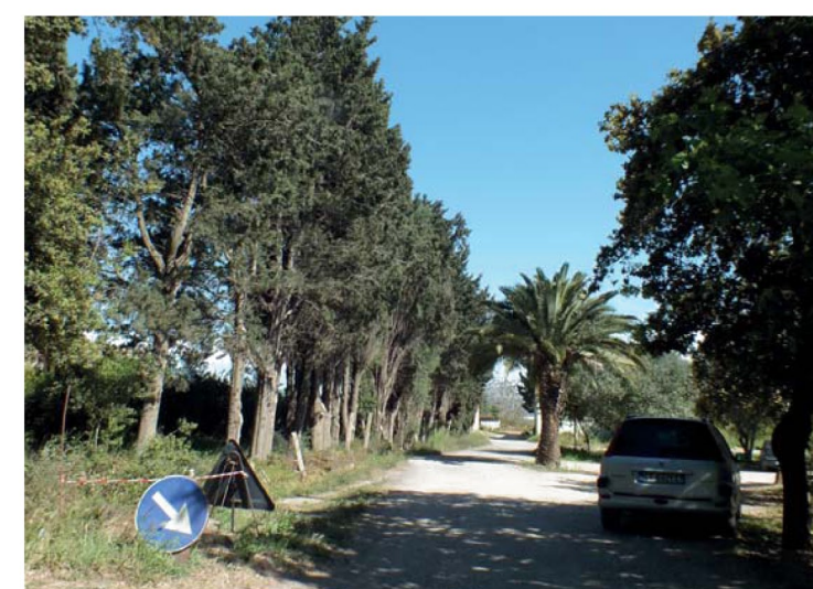
6. Viale d'accesso