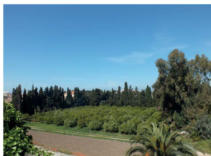
13. Agrumeti, vista d'insieme