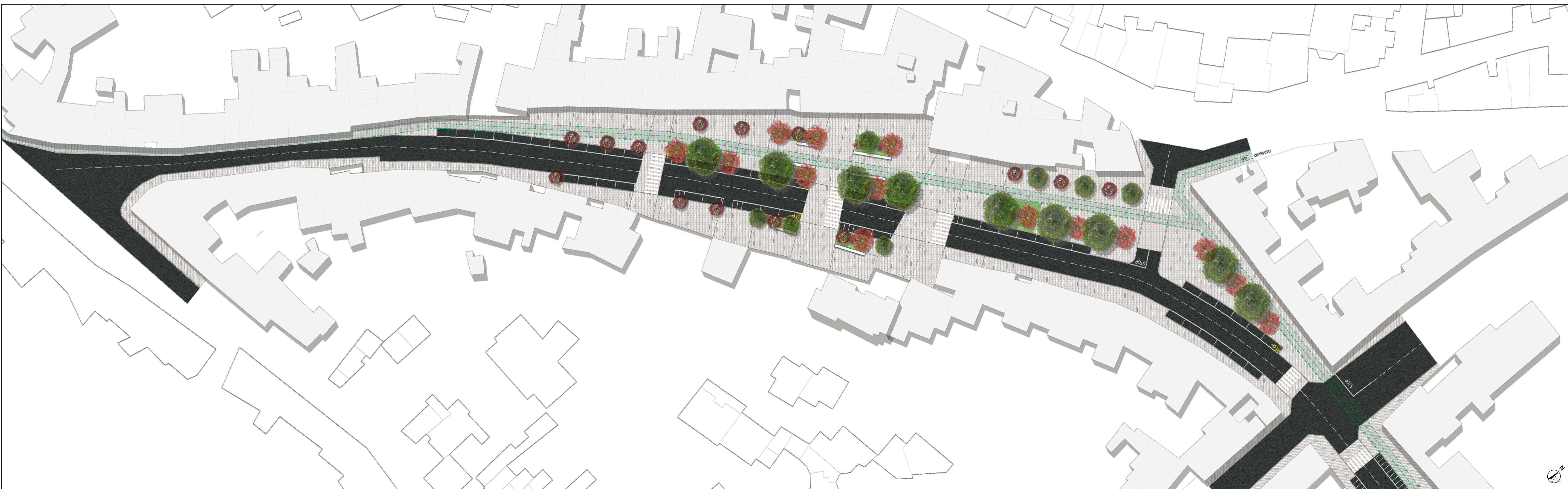
Planimetria di progetto Scala 1 : 500