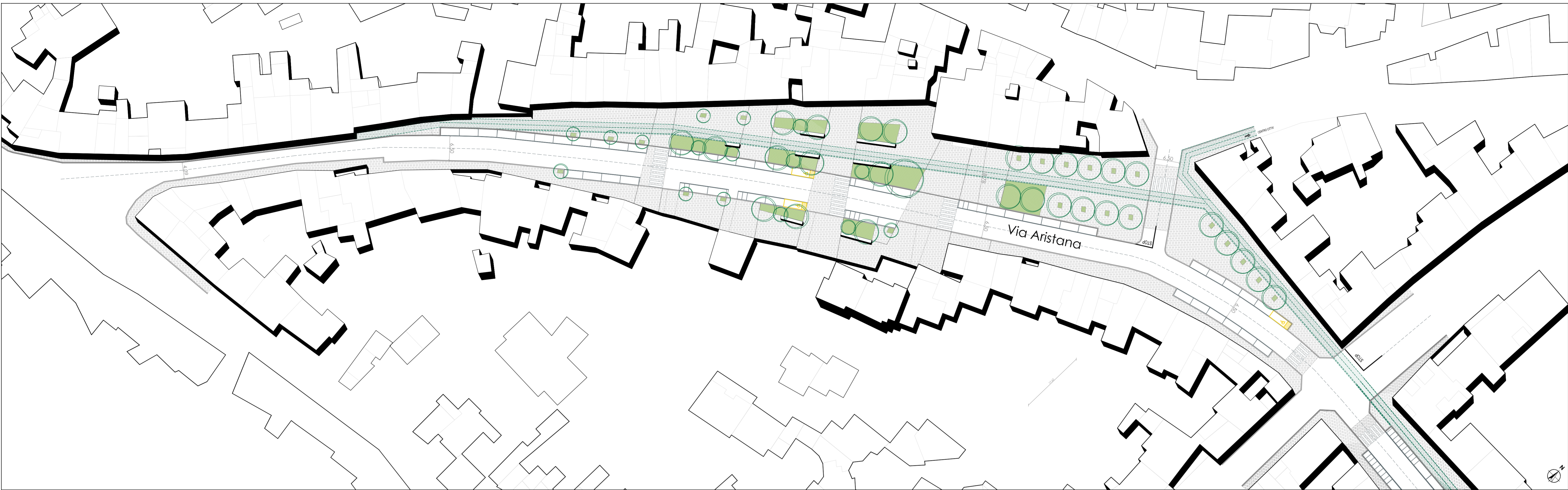
Planimetria quotata di progetto Scala 1 : 500