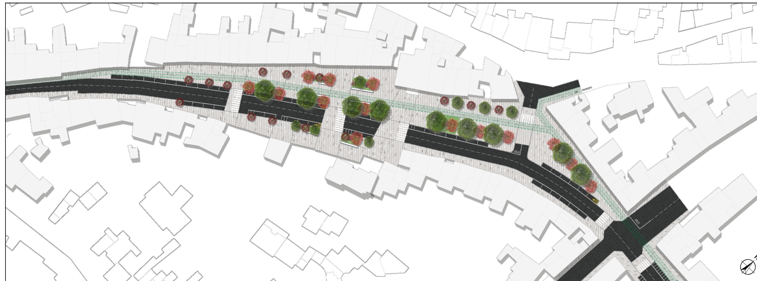
Planimetria arredata di progetto Scala 1 : 1.000