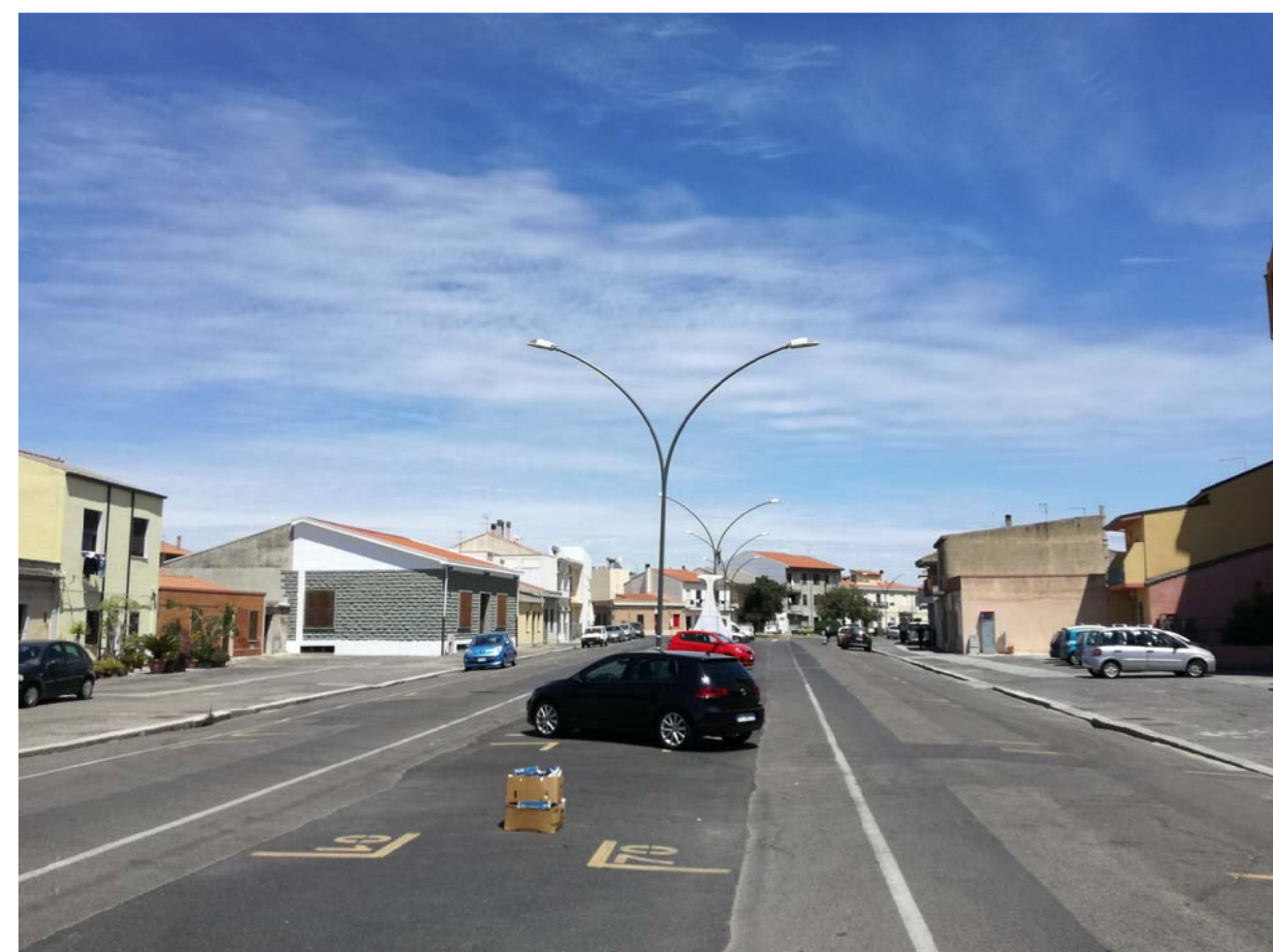
Foto Via Aristana allo stato attuale