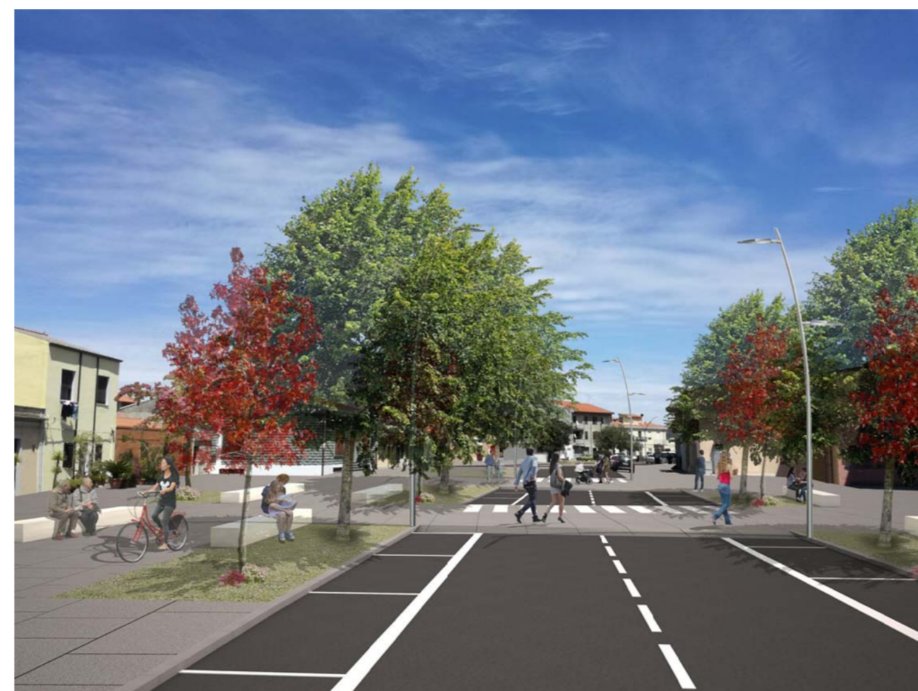
Fotosimulazione dell'intervento in progetto