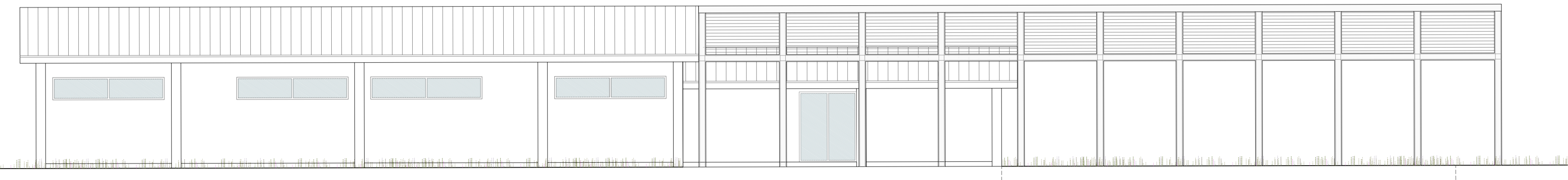
PROSPETTO NORD scala 1:100

"Programma straordinario di intervento per la riqualificazione urbana e la sicurezza delle periferie delle città metropolitane e dei comuni capoluogo di provincia"