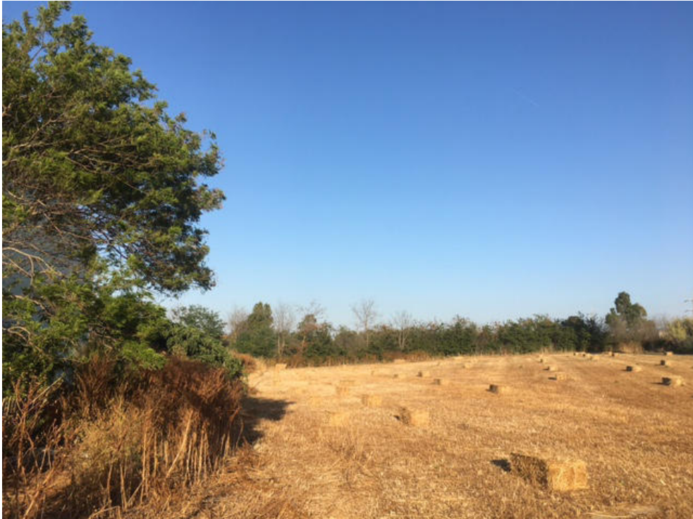
Vista dell'area dove sorgerà l'archivio verso la ferrovia