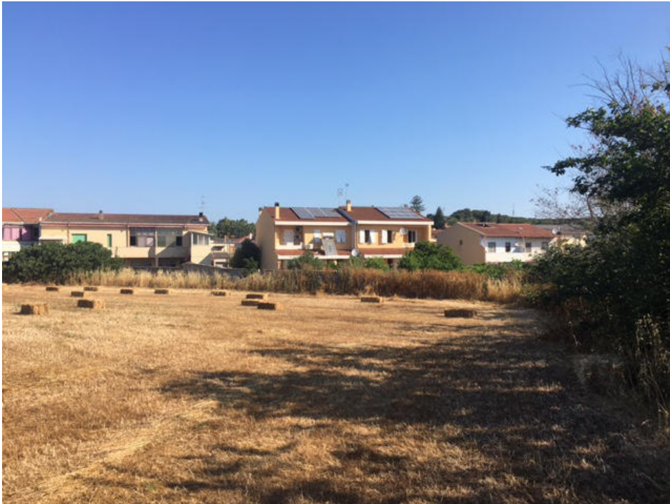
Vista dell'area di intervento verso gli edifici sulla via Buonarroti