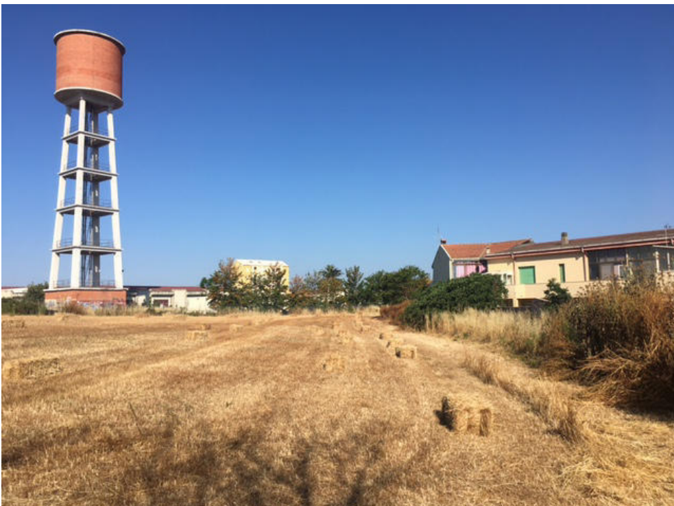
Vista dell'area dove sorgerà l'archivio verso il foro boario