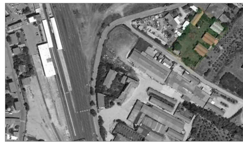
TAVOLA 09 ORISTANO GIU 2017